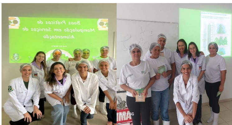
Figura 2. Foto dos alunos do Curso de Nutrição da UFOP com os manipuladores nutricionista do LSVP, durante o treinamento de boas práticas.

Seis dos 8 manipuladores da unidade de alimentação e nutrição (UAN) da ILPI de Ouro Preto relataram ter recebido treinamento para manipulação de alimentos e demonstraram empenho quanto ao desenvolvimento da qualidade dos seus serviços. No entanto, algumas deficiências evidentes refletiram baixa segurança dos produtos alimentícios elaborados. Abaixo estão alguns dos colaboradores que participaram do treinamento, junto com a Nutricionista responsável pelo LSVP (Figura 2).