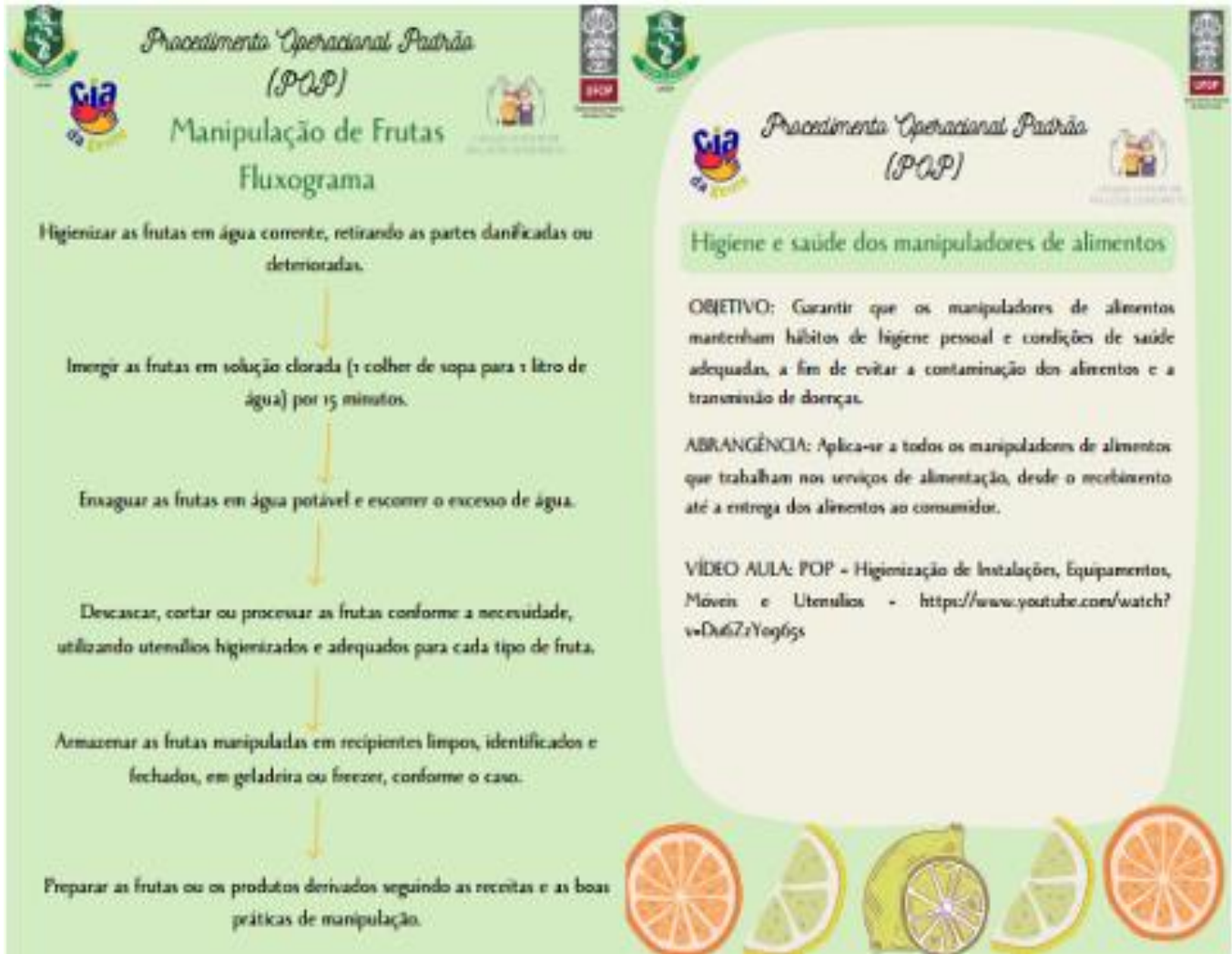
Figura 3. Imagem de um dos POP's, para exemplificar.

tratamento. Consequentemente, deve ser adequada nutricionalmente e não oferecer riscos à saúde dos idosos (PBH-SUS, 2016; Garcia-Júnior; Rodrigues, 2023; Nunes et al., 2024).