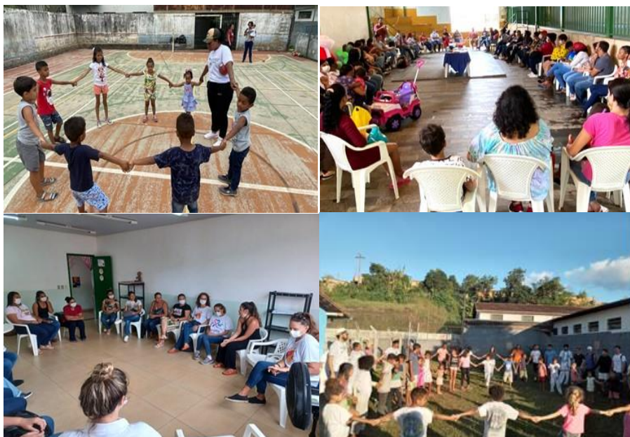
Figura 5. Rodas realizadas com moradores e moradoras de Antônio Pereira em 2023.

O acolhimento, como política e postura (Chauchard, 1973), é fundamental nessa construção, materializando-se na oferta de espaços e atividades tranquilos, prazíveis, seguros e acessíveis para o encontro das pessoas. Por sua vez, o empoderamento, enquanto intenção política das ações de saúde e educação realizadas pelo programa, busca fortalecer os moradores e moradoras para restauração e garantia da saúde coletiva da comunidade e território (Vasconcelos, 2003).