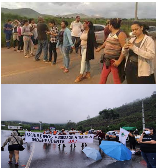
Figura 1. Imagens das lutas da comunidade de Antônio Pereira.

O protagonismo das mulheres de Antônio Pereira (Figura 1), das associações comunitárias, professores e trabalhadores da saúde do distrito foi capaz de mobilizar as forças sociais e institucionais para apoiá-los na luta por vida digna e reparação do seu território.