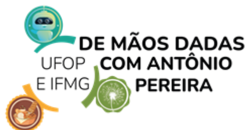
Figura 2. Roda virtual de lançamento e logomarca do programa, em 2021.