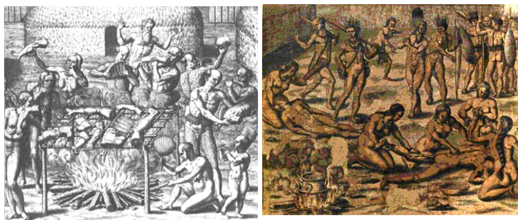
Gravuras representando a antropofagia nas obras Viagem à Terra do Brasil (a direita), de Jean de Léry, e Duas viagens ao Brasil (à esquerda), de Hans Staden, reproduzidas na edição de 1592 da América tertia pars memorabilis provinciae historiae continens , de Theodor De Bry.

Essas representações imagéticas eram costumeiramente baseadas nos relatos como os de Hans Staden, André Thevet e Jean de Léry. Daí a recorrência de temas como a nudez 26 , o canibalismo 27 e a indolência 28 provocada pelo clima tropical muito freqüente nesses escritos. Muitos dos pintores das alegorias não possuíam experiência do Brasil que não fosse por intermédio dos relatos escritos. Os relatos de viagem e especialmente os três supracitados constituíram as principais fontes para os pintores das alegorias, influenciando-os tanto nos temas, quanto nos motivos 29 escolhidos para representá-los. As representações pictóricas acabavam sendo tentativas de transposição do texto em imagem. Podem-se tomar como exemplo dessa transposição as ilustrações das edições dos relatos de viagem. Abaixo, temos as gravuras sobre a antropofagia dos textos de Hans Staden (à esquerda) e de Jean de Léry (à direita).