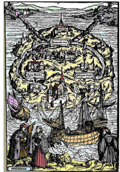
Mapa da Utopia, desenhado por Ambrosius Holbein para a edição de Utopia impressa na Basileia, em 1518. Atualmente, existem oito exemplares da primeira edição, um deles abrigado na Lauingers Library, em cujo site foi visualizada a gravura utilizada neste artigo.

Gonsalves de Mello destaca que “há anos vinham sendo reunidos na Holanda dados e informações sobre a capitania de Pernambuco, a configuração de sua costa, os portos, desembarcadouros, regime dos ventos, sua riqueza, sua agricultura” (MELLO, 1987: 36). Nesse momento, navios holandeses habituavam-se a visitar os portos pernambucanos, prontos para atuarem como piratas. Exemplo de relato detalhado sobre a costa de Pernambuco é a relação escrita por Hessel Geritsz descrevendo o desembarcadouro de Pau Amarelo. Estudos como o do mercador e diplomata da Companhia das Índias Ocidentais Willem Usselinx (1567-1647) sobre a produção açucareira da colônia portuguesa e o trabalho Motivos por que a Companhia das Índias Ocidentais deve tentar tirar ao Rei da Espanha a terra do Brasil e isto o quanto antes (Amsterdã, 1624) de Van Vaernewyck, ou a Lista do que o Brasil pode produzir anualmente , aparecem como reflexo da nova fase da jornada colonial neerlandesa. Entretanto, essa literatura geográfica não será desenvolvida na zona meridional dos Países Baixos, reconquistada pelas tropas espanholas. 19 O Brasil também será objeto de referências nos textos literários da época, como na já aqui mencionada peça de Jan Van Hout, e também aparecerá nas correspondências de Hugo Grotius (1583-1645) ou do poeta Dirk Coornhert 20 (1522-1590).