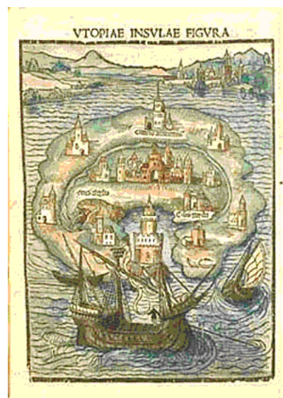
Gravura da ilha da Utopia presente na edição flamenga de 1516. na outra página Mapa da utopia.

Descrições mais detalhadas das terras brasileiras viriam nas edições em holandês das Duas Viagens de Hans Staden (tradução flamenga de 1558) e das Singularidades da França Antártica , de André Thevet 13 (1502-1590). Houve ainda uma tradução parcial de Viagem à Terra do Brasil do huguenote Jean de Lery 14 (1534-1611). Podemos ressaltar alguns capítulos alusivos ao Brasil em edições da História do Descobrimento e Conquista da Índia pelos portugueses , de Lopes de Castanheda 15 (1500-1559), dos escritos de Symon Grynaeus 16 (1493-1541) ou das cartas jesuíticas. A literatura circulante era bastante variada, abrangendo livros de navegação, costumes, tratados de direito, dicionários ou colóquios multilíngües, livros de medicina e vários outros escritos humanísticos. Referências à fauna e à flora brasileiras aparecem nos livros de Carolus Clusius 17 (1525-1609), que editou em latim o Colóquio dos Simples , de García de Orta; e no Theatrum Orbis Terrarum , de Abraham Ortelius (1527-1598).