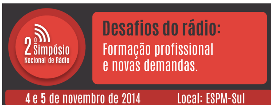
Figura 9: Banner de divulgação do II Simpósio Nacional do Rádio Fonte: Dados da pesquisa (2021).