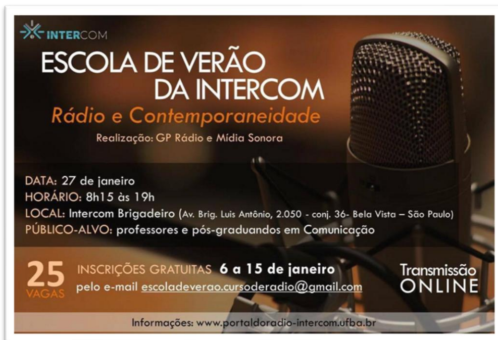
Figura 12: Flyer de divulgação da Escola de Verão

“Radiodramatização e linguagem radiofônica” (Eduardo Vicente), “O rádio público no Brasil” (Valci Zuculoto). O curso teve transmissão on-line e as aulas estão disponíveis para acesso e download gratuito 24 .