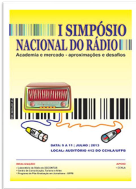
Figura 8: Banner de divulgação do I Simpósio Nacional do Rádio Fonte: Dados da pesquisa (2021).