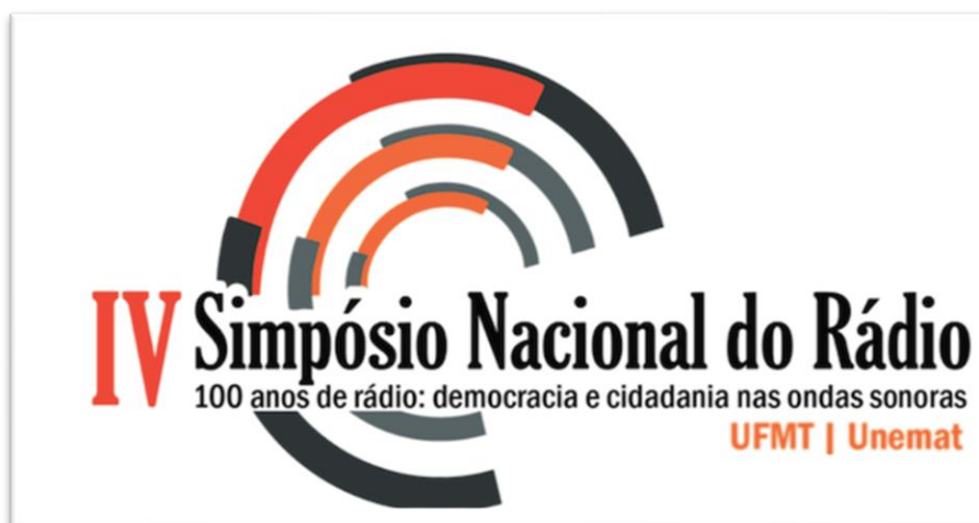
Figura 11: Banner de divulgação do IV Simpósio Nacional do Rádio

com realização nos dias 5, 6 e 7 de maio de 2021. O Simpósio teve oito Grupos Temáticos: História do Rádio; Rádio Expandido e Convergência; Estudos em Podcasting; Rádio, política, direitos humanos e cidadania; Radiojornalismo; Música, arte e vínculos na radiodifusão; Radiodifusão universitária; Rádio e esporte.