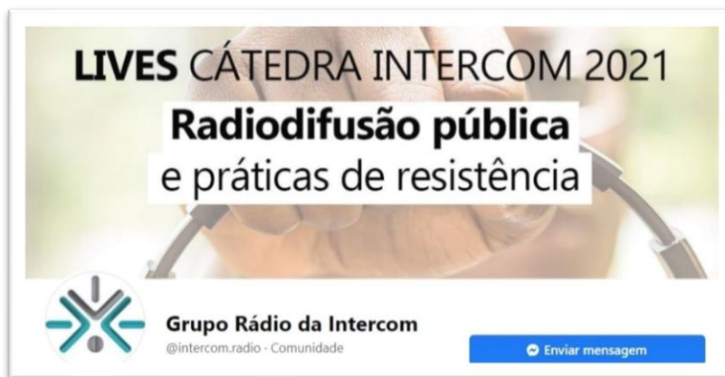
Figura 2: Print do perfil do GP no Facebook

Além do site, o grupo possui perfis em redes sociais. No Facebook ( https://www.facebook.com/intercom.radio ), o perfil possui 1.540 seguidores 11 :