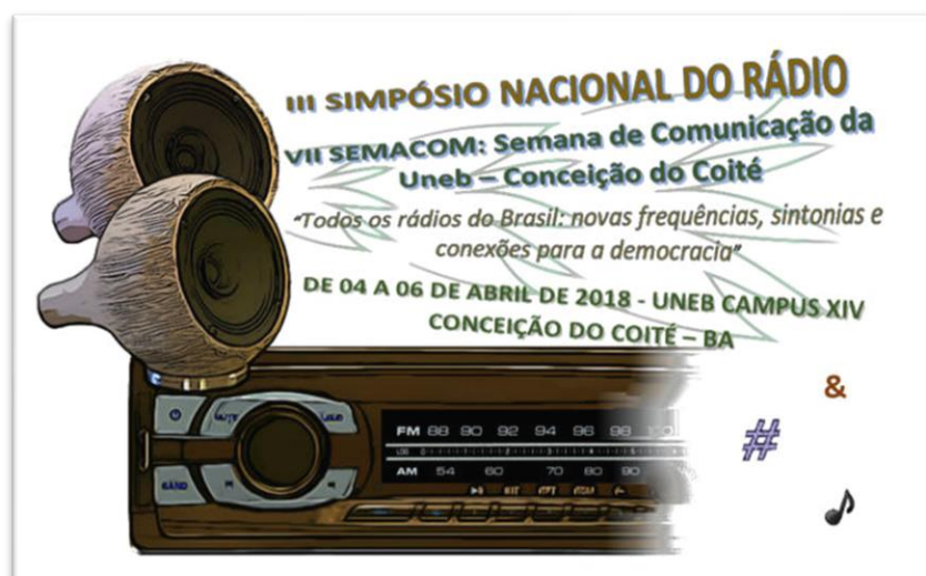
Figura 10: Banner de divulgação do III Simpósio Nacional do Rádio Fonte: Dados da pesquisa (2021).