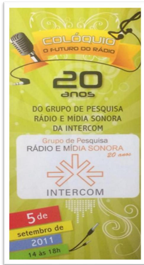
Figura 6: Flyer de divulgação do colóquio O futuro do rádio

Ainda em 2011, o grupo produziu uma série de programas e entrevistas especiais em comemoração aos 70 anos da primeira emissão do Repórter Esso. A série, coordenada por Maria Cláudia Santos, teve intensa repercussão em todo o país, pois o GP produziu e disponibilizou farto material inédito e de qualidade para download gratuito 18 . A agência RadioWeb colocou o material à disposição das emissoras de todo o país e o material foi veiculado por 702 emissoras, localizadas em 579 municípios. No período entre 19 e 28 de agosto, outra agência, a Rádio2, colocou à disposição das emissoras a série produzida pelo GP e 153 rádios baixaram o material, cobrindo 628 praças. Ao todo foram 753 downloads . A Abert disponibilizou a série no site da entidade e foram feitos 941