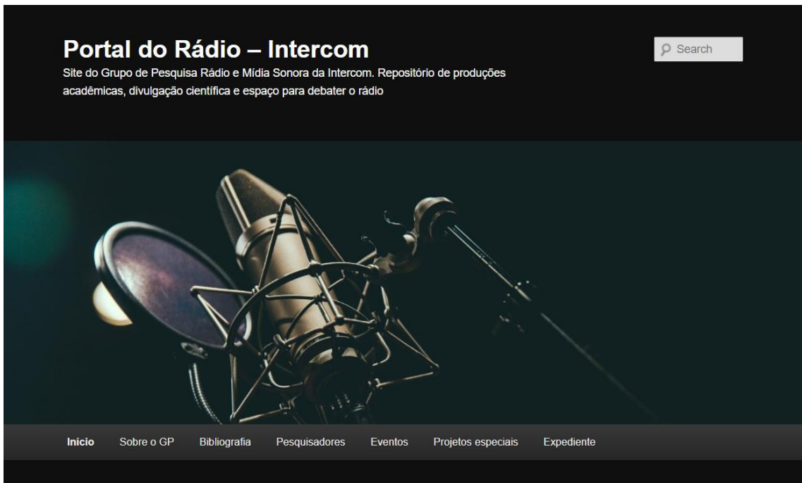
Figura 1: Print da homepage do Portal do Rádio

Além do site, o grupo possui perfis em redes sociais. No Facebook ( https://www.facebook.com/intercom.radio ), o perfil possui 1.540 seguidores 11 :