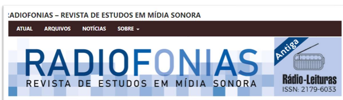
Figura 5: Print da homepage da Revista Radiofonias

em Mídia Sonora , antiga Rádio-Leituras (ISSN 2179-6033). A revista é uma publicação quadrimestral do Programa de Pós-Graduação em Comunicação da Universidade Federal de Ouro Preto, do Grupo de Pesquisa Convergência e Jornalismo (ConJor) e do Núcleo de Rádio e TV (NRTV) da Universidade Federal do Rio de Janeiro (UFRJ). Segundo a publicação, "o objetivo da revista é ser um espaço para análise e reflexão sobre o rádio, a mídia sonora, o radiojornalismo e os processos de convergência que dialoguem direta ou indiretamente com as diversas modalidades de comunicação sonora" (RADIOFONIAS, 2021).