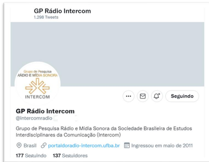
Figura 3: Print do perfil do GP no Twitter

E também há um canal no YouTube 13 , com vídeos de cursos e palestras organizados pelo grupo: