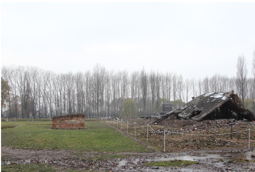
1. Ruinas de la cámara de gas de Birkenau. Estado actual (2016). Autor: Pnapora. Fuente: Wikimedia Commons. (Licencia Creative Commons Atribución-CompartirIgual 4.0 Internacional)

Un lugar como este exige a su visitante que se interrogue, en algún momento, sobre sus propios actos de mirada. 9