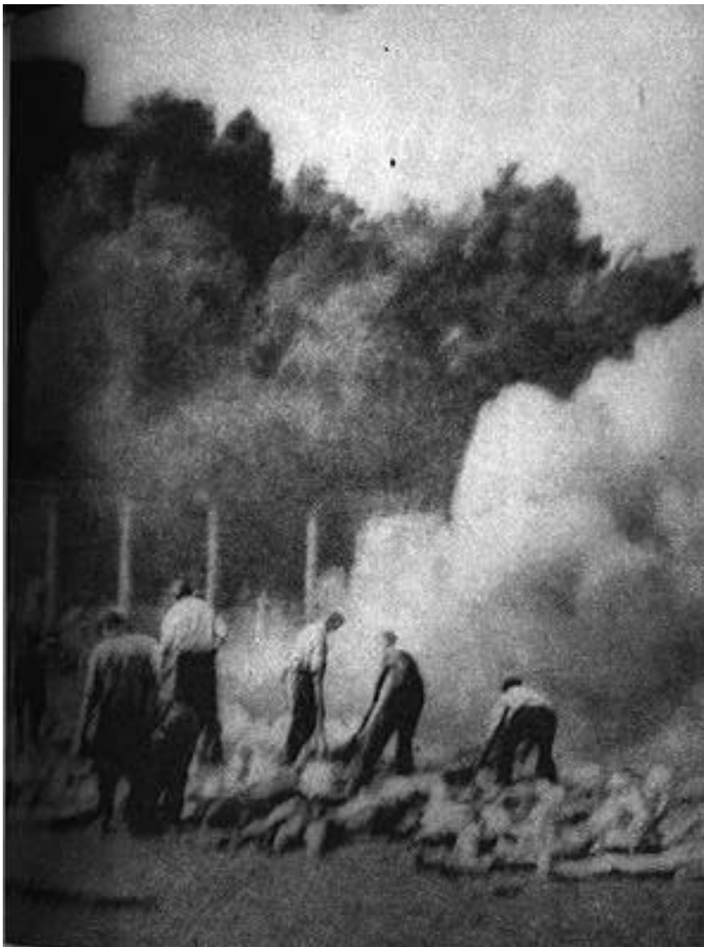
6. Detalle de la fotografía 281 de los Sonderkommando (ver imagen 5).