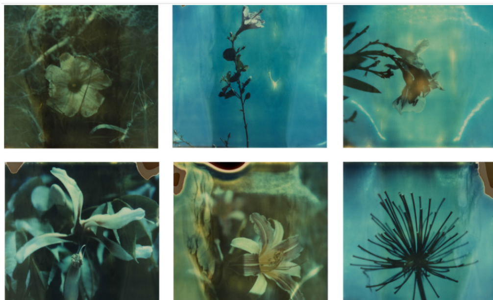
11. “Flores en la ESMA” (detalle). Gabriel Díaz. 2015. Toma directa sobre película Polaroid, de 60 x 191 cm. Disponible en: https://palaisdeglace.culturalspot.org/asset-viewer/flores-en-la-esma/XQEKqtXUxZxiRQ?hl=es .

Desde el punto de vista poético, Díaz describe su trabajo como “hablar de la vida en territorios de la muerte”. La flor, de este modo, aparece cumpliendo su función metafórica tradicional: el momento de la primavera y de la apertura vital. Las flores están por los niños nacidos en la ESMA, en su lugar y como sus representantes, a ellos refieren también en su vínculo con lo vital. Pero el territorio de la muerte, resulta aquí un horizonte particular. Las flores son arrancadas, pierden así la potencia fructífera, pero se mantienen como regalos, como lo que se regala al ser amado o al muerto. La materialidad de la fotografía, modulada por los papeles vencidos y la imprevisibilidad de lo que pudiera revelarse parece imprimirse sobre una dimensión secreta del territorio, lo que la tierra esconde como tierra de muerte. Pero el químico vencido tiene incluso otra potencia, la de hacer aparecer la imagen como tal, es decir, como fantasma. La distorsión que se produce entre la supuesta impresión de lo “real” sobre el papel y el desvío que sobre dicho proceso sucede, hace aparecer una imagen que no es ni la superficie que cumple la función de medio para su aparición, ni la mera representación de lo fotografiado, bajo la manipulación técnica del fotógrafo. La imagen que allí aparece, esa imagen no intencionada, al mismo tiempo impide el revelado y oculta a su modo lo que debería aparecer para hacerse ella misma visible.