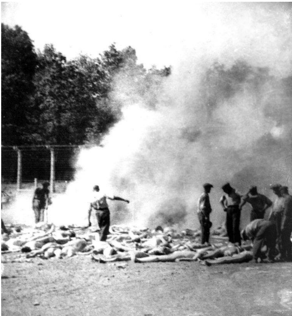
4. Detalle de la fotografía 280 de los Sonderkommando (ver imagen 3).