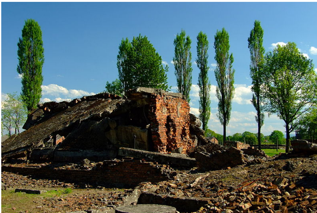
2. Ruinas de la cámara de gas de Birkenau. Estado actual (2012). Autor: Morneomorneo. Fuente: Wikimedia Commons. (Reconocimiento-Compartir bajo la misma licencia 3.0 Polonia de Creative Commons)

Precisamente es la mirada como acto lo que pone en juego, en este punto, el pensador. Y lo hace a través de la problematización de una instalación minimalista que se encuentra hoy en día en Birkenau: tres fotografías. Como es bien conocido, los miembros de un Sonderkommando tomaron allí cuatro fotografías, testimonio imaginal del exterminio. Hoy, en Birkenau, solo se encuentran exhibidas a la mirada del visitante tres de ellas.