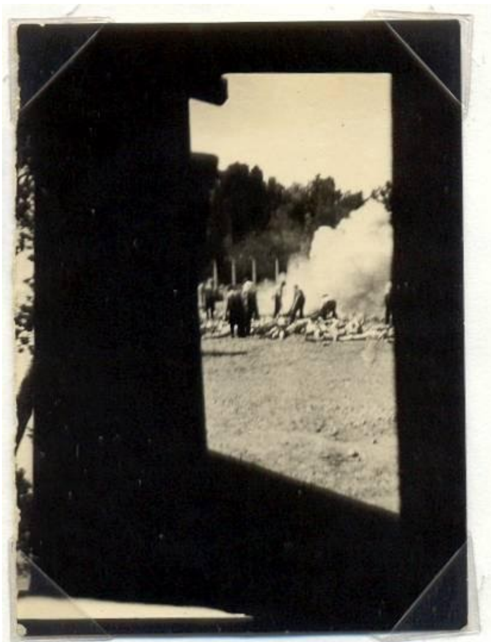
5. Fotografía 281 de las “Fotografías de los Sonderkommando”. Tomada desde el interior de un horno crematorio en 1944 por Alberto Errera. La imagen muestra la cremación de cadáveres en una hoguera, desde el marco negro de la puerta o ventana de la cámara de gas. Imagen de dominio público disponible en Wikimedia Commons.