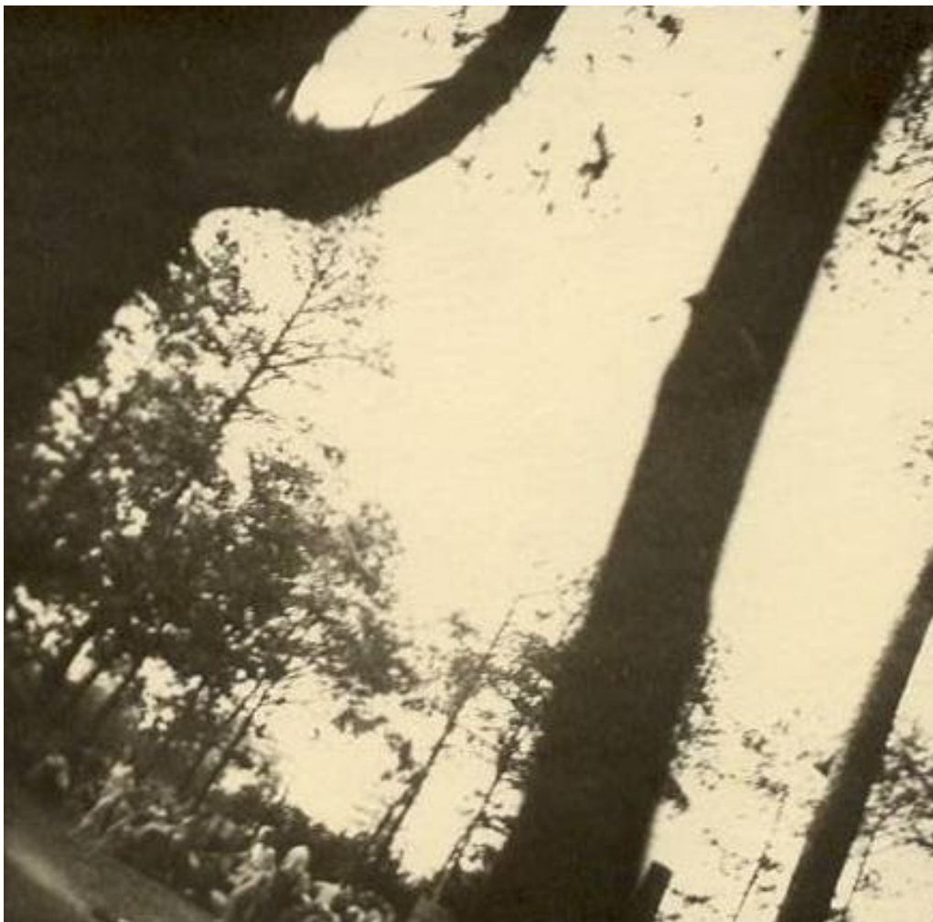
7. Fotografía 282 de las “Fotografías de los Sonderkommando”. Tomada desde el interior de un horno crematorio en 1944 por Alberto Errera. La imagen muestra a un grupo de mujeres desnudas justo antes de entrar en la cámara de gas. Imagen de dominio público disponible en Wikimedia Commons.