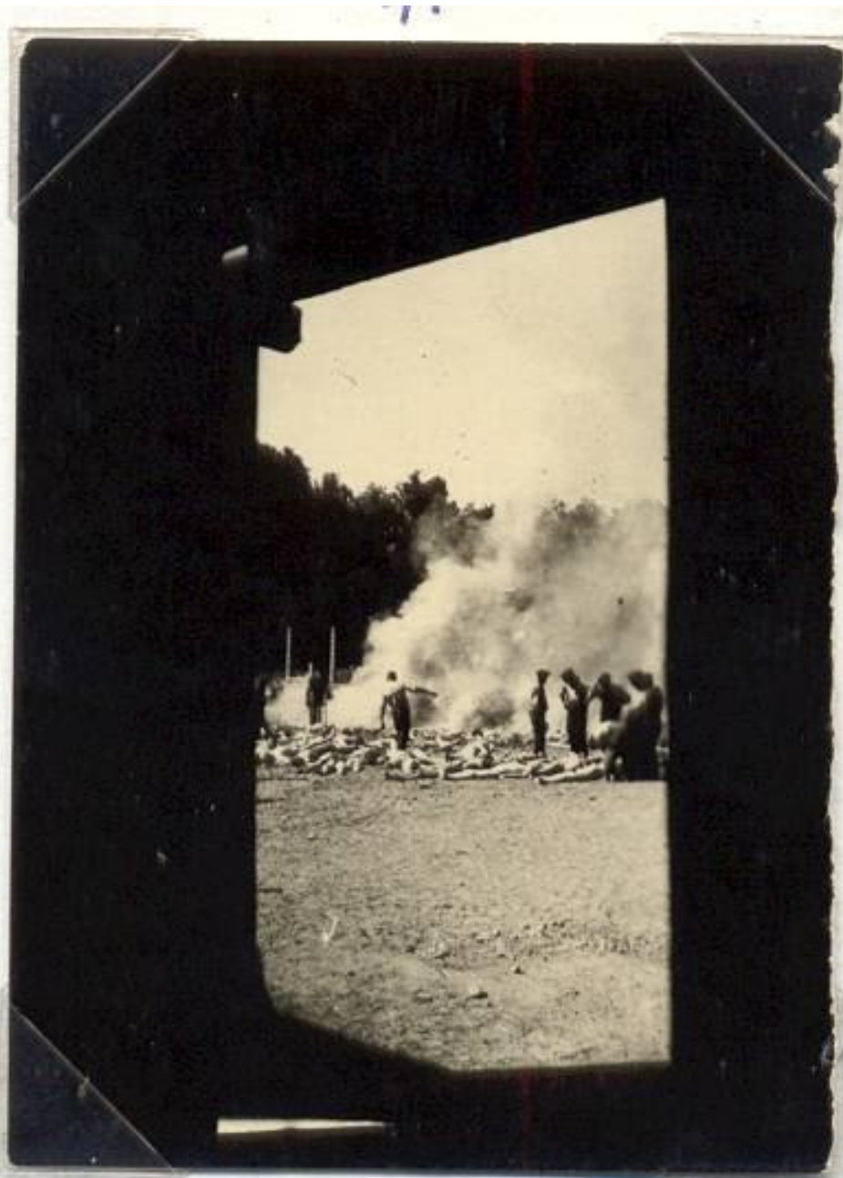
3. Una de las cuatro fotografías conocidas como “Fotografías de los Sonderkommando”. En el Museo Estatal de Auschwitz-Birkenau lleva el número 280. Tomada desde el interior de un horno crematorio en 1944 por Alberto Errera, miembro de los Sonderkommando de origen griego asesinado ese mismo año. La imagen muestra la cremación de cadáveres en una hoguera, desde el marco negro de la puerta o ventana de la cámara de gas. Imagen de dominio público disponible en Wikimedia Commons.